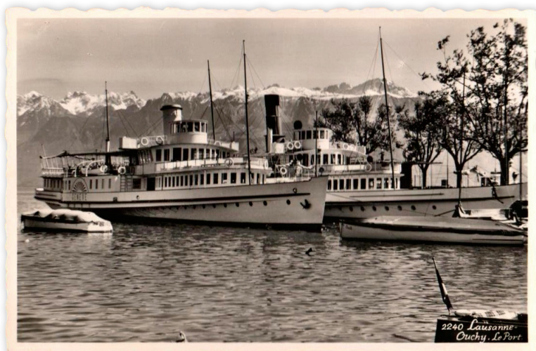
Carte postale illustrée (photo) du port d'Ouchy-Lausanne, avec deux bateaux de la CGN : au premier plan, on distingue le « Genève ».

En effet : depuis quelques décennies, tout a changé ! Tout d'abord, la boîte aux lettres sur le bateau a été enlevée, puis, par exemple, le bureau de poste d'Ouchy-Lausanne a été fermé il y a quelques années. Mais ... soyez rassurés amis collectionneurs : chaque bateau dispose encore aujourd'hui de son « cachet de bord » ! Aujourd'hui, on peut donc demander qu'il soit apposé sur des cartes ou des lettres en se rendant au guichet qui vend les billets sur le bateau ! ●●●