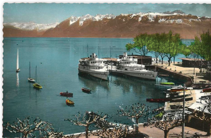
Carte postale illustrée (photo couleurs) montrant le port d'Ouchy (Lausanne) avec deux bateaux de la CGN au débarcadère. Au loin, on voit les Alpes valaisannes.