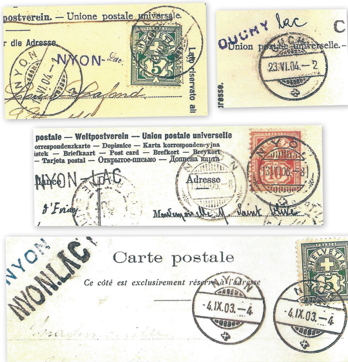
Divers documents (dont des cartes postales) portant la marque de plusieurs ports suisses et la mention « lac » (tampon ou à la main) qui atteste que le courrier avait été déposé sur l'un des bateaux de la CGN.