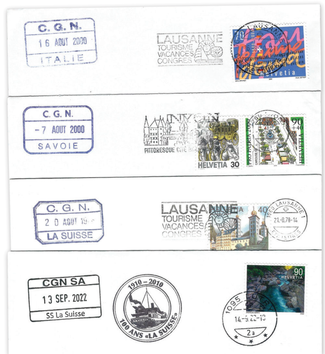
Plusieurs cachets de bord récents de bateaux de la CGN : « Italie », « Savoie » et « La Suisse ». Celui de tout en bas (« La Suisse ») porte en plus un cachet-souvenir des 100 ans de ce bateau-amiral de la CGN en 2010. Les lettres ont été postées à Lausanne, Nyon et Lutry, trois ports de la CGN, conformément à la nouvelle réglementation.