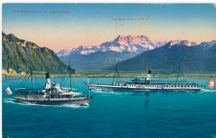
Carte postale illustrée (photo colorisée) avec deux bateaux de la CGN ( l'Italie et le Simplon ) se croisant au large de Montreux.

Huit bateaux font partie de cette catégorie particulière (entre parenthèse, leur année de construction) : cinq sont des « bateaux à vapeur avec roues à aubes » classés « monuments historiques d'importance nationale » en 2011 ( La Suisse 1910, Simplon 1915, Montreux 1904, Savoie 1914 et Rhône 1927), et trois « bateaux diesel-électrique avec roues à aubes » : Vevey 1907, Italie 1908 et Helvétie 1926 (en attente de rénovation). Le « Genève » ne fait plus partie de la flotte de la CGN et est amarré à quai à Genève. De si vieux bateaux et ils fonctionnent encore, allez-vous dire ? Eh bien oui ! Ils ont été régulièrement entretenus pendant des décennies et ils font l'objet, à tour de rôle, de rénovations avant d'être remis en service.