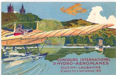
Seconde carte postale spéciale illustrée vendue lors du Concours international d'hydro-aéroplanes à Lausanne-Ouchy en 1912, dont les vols ont eu lieu sur le lac Léman.