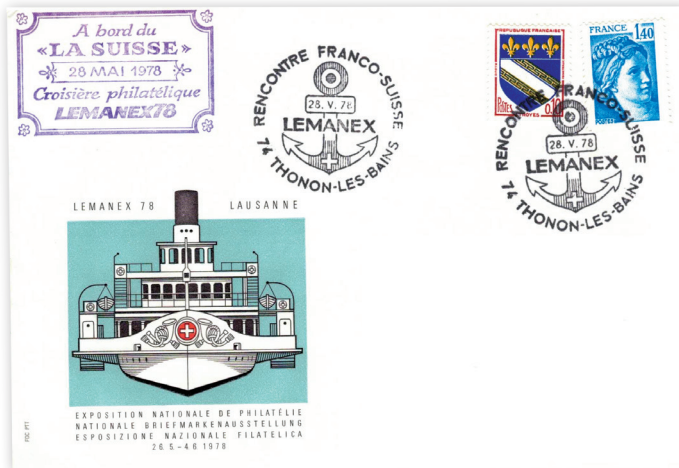
Enveloppe spéciale de l'exposition philatélique nationale « LEMANEX 1978 » et de sa croisière philatélique (tampon spécial en haut à gauche). Une rencontre franco-suisse avait été organisée à Thonon-Les-Bains, où la Poste française utilisa un cachet postal spécial.