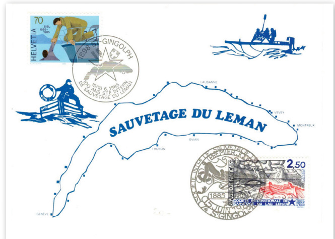
Enveloppe spéciale créée à l'occasion du Centenaire de la « Société Internationale de Sauvetage du Léman ». En haut à gauche, le timbre spécial suisse (oblitéré à St-Gingolph - Suisse) et à droite en bas le timbre spécial français (oblitéré à St-Gingolph - France).