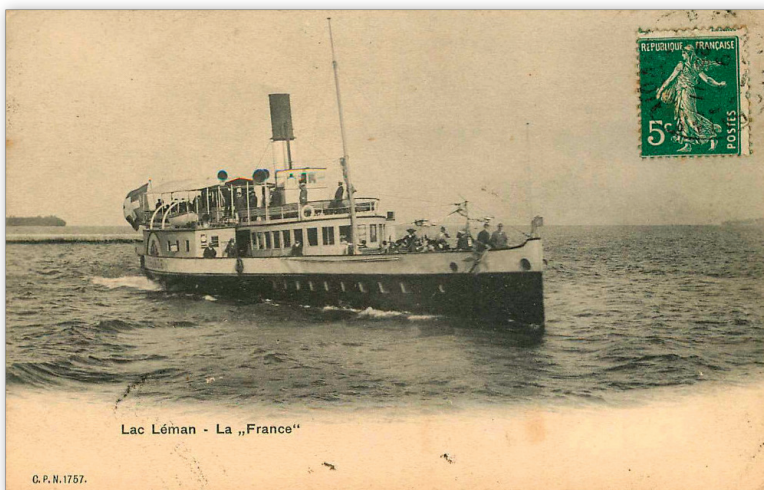
Rare document (carte photographique) du bateau « France » de la CGN, affranchi avec un timbre français « La Semeuse » de 5ct (date du cachet postal illisible).