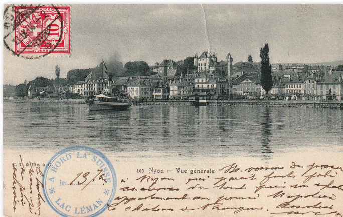
Carte postale illustrée (vue de Nyon) postée à bord du bateau « La Suisse », avec le cachet de bord (rare) en bas, avec la mention « Lac Léman » dans le tampon, et la date manuscrite. Le timbre suisse en haut à gauche est oblitéré « Ouchy » en date du 13.IX.04.

●●● Ensuite, chacun est libre de poster son courrier dans le bureau de poste du port qui lui convient, ou dans n'importe quelle une boîte aux lettres standard jaune de la Poste suisse (mais l'oblitération sera alors celle du centre de tri !).