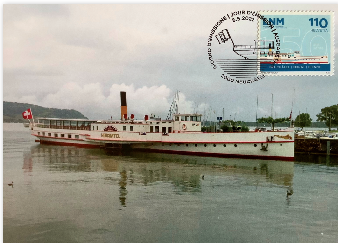
Carte maximum du 5 mai 2022 reproduisant une photo du bateau « Neuchâtel » de la Compagnie de navigation des lacs de Neuchâtel et Morat, et qui navigue aussi sur celui de Biemme. En haut à droite, le timbre-poste spécial de la Poste Suisse émis pour les 150 ans de la Compagnie.