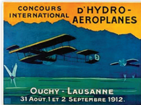
L'une des deux cartes postales spéciales (dessin en couleurs) émise à l'occasion du Concours d'hydro-aéroplanes à Ouchy-Lausanne en 1912 qui s'était déroulé sur le lac Léman.

Ils en existent de très nombreuses montrant des bateaux de la CGN (reproduction de photos) au recto, aussi bien en noir/blanc qu'en couleurs. Si elles portent le cachet de bord du bateau sur le côté de l'adresse, elles sont spécialement intéressantes ! De quoi se constituer une très belle collection thématique ! Pendant des décennies, elles étaient vendues à bord des bateaux et des kiosques près des ports d'embarquement. A noter aussi les cartes postales illustrées touristique en couleurs pour Montreux ou Lausanne, ou les cartes de reproduction des affiches de la CGN, sur lesquelles on voit un bateau de la CGN. Le livre de l'ABVL (voir « Références ») reproduit une trentaine de cartes en couleurs, dont certaines sont très anciennes. Une série plus moderne – des dessins en aquarelle - est en vente auprès de l'ABVL.