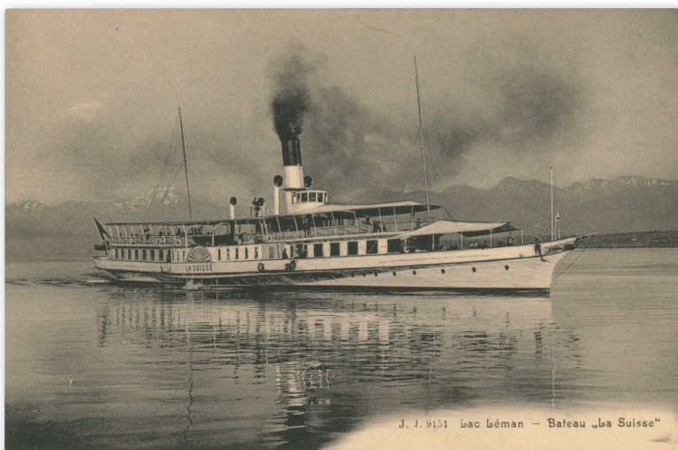
Carte postale illustrée (photo) du bateau-amiral de la flotte de la CGN, le « La Suisse » naviguant à pleine vapeur sur le lac Léman.