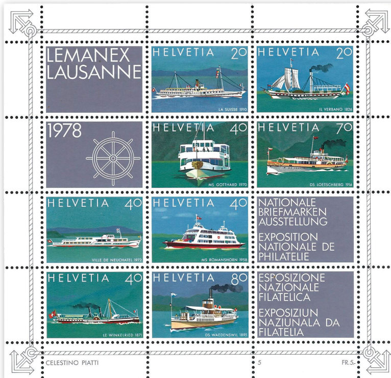
Très beau bloc-feuillet émis à l'occasion de la grande Exposition philatélique nationale suisse LEMANEX de 1978 à Lausanne. Sur les timbres-poste, on voit huit bateaux anciens naviguant sur plusieurs lacs de Suisse. S'agissant du lac Léman, ce sont les bateaux « La Suisse » et « Winkelried » qui ont été illustrés sur deux des huit timbres-poste.

●●● Un très beau bloc-feuillet avait été mis en vente le 9 mars 1978 à l'occasion de cette LEMANEX, sur lequel on peut voir 8 bateaux anciens naviguant sur plusieurs lacs de Suisse illustrés sur 8 timbres-poste (voir illustration). S'agissant du lac Léman, ce sont les bateaux « La Suisse » (navire-amiral de la CGN) et le « Winkelried » qui ont eu l'honneur de figurer sur deux timbres-poste de ce bloc. Huit enveloppes spéciales, dont six honorant des bateaux anciens naviguant sur six lacs de Suisse et deux bateaux du Léman (dont le « Winkelried », seul bateau avec deux cheminées ayant navigué de 1870 à 1918 sur le Léman) ont été vendues lors de cette exposition philatélique nationale.